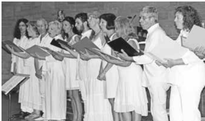
Der Chor Noctambules aus Frankreich bei seinem Besuch im Juli 2019 in der Bergtheimer Kirche.

Noch ein Hinweis: Am Freitag, 3. April 2020, ist wieder ein Kabarettabend in Bergtheim, den der Partnerschaftsverein organisiert. Bitte den Termin mit Mc Härder schon jetzt im Kalender vormerken!