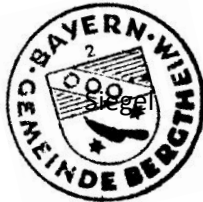
Konrad Schlier 1. Bürgermeister

Die Beitrags-und Gebührensatzung zur Wasserabgabesatzung der Gemeinde Bergtheim (BGS/WAS) vom 11.08.2022 wurde am 14.09.2022 in der Verwaltungsgemeinschaft Bergtheim zur Einsichtnahme niedergelegt. Hierauf wurde durch Anschlag an allen Amtstafeln hingewiesen. Die Anschläge wurden am 14.09.2022 angeheftet und am 04.10.2022 wieder abgenommen.