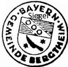
Konrad Schlier 1. Bürgermeister

Die Satzung für die öffentliche Wasserversorgungseinrichtung der Gemeinde Bergtheim (Wasserabgabesatzung –WAS–) vom 11.08.2022 wurde am 13.10.2022 in der Verwaltungsgemeinschaft Bergtheim zur Einsichtnahme niedergelegt. Hierauf wurde durch Anschlag an allen Amtstafeln hingewiesen. Die Anschläge wurden am 13.10.2022 angeheftet und am 28.10.2022 wieder abgenommen.