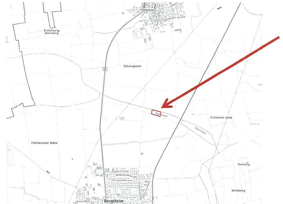
Übersicht Lage des Vorhabens (ohne Maßstab)

Das Plangebiet hat eine Größe von 3453 qm und liegt nordöstlich von Bergtheim (siehe folgende Abbildung zur Übersicht). Der Geltungsbereich umfasst eine Teilfläche des Flurstücks 6244, Gemarkung Bergtheim sowie einen Teilbereich des Flurstücks 4908 Gemarkung Bergtheim.