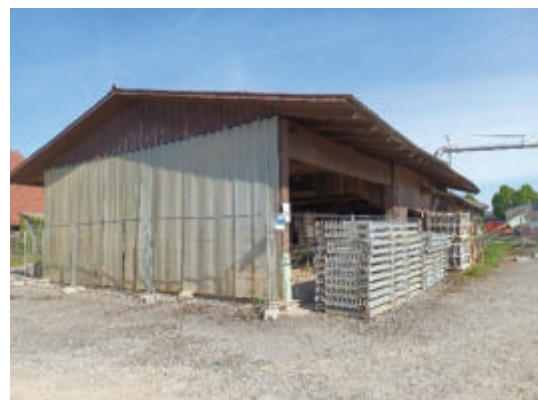
Sägewerk, Blick von Südosten. (PLÖG, 2025)