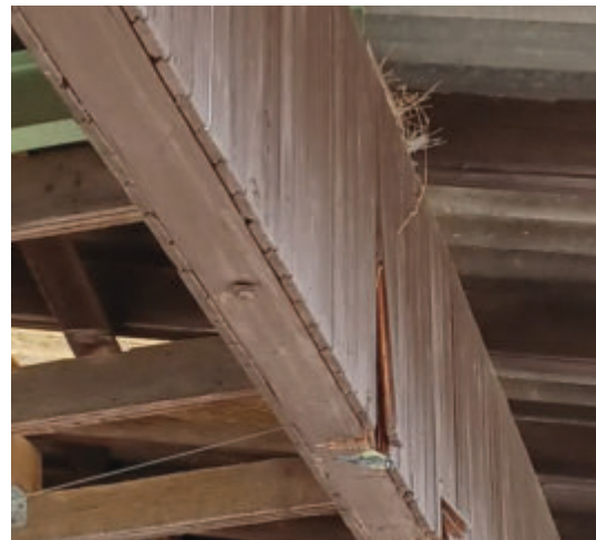
Blaumeise an Zugang zum Nest, darüber ungenutztes Taubennest, beides Sägewerk. (PLÖG, 2025)