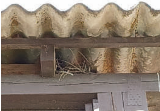
Ungenutztes Taubennest unter dem Dach des Silos (PLÖG, 2025)

Blaumeise ( Cyanistes caeruleus ), Hausrotschwanz ( Phoenicurus ochruros ), Hausperling ( Passer domesticus ), Mehlschwalbe ( Delichon urbicum ), Straßentaube ( Columbus livia ): Die Arten dieser Gilde haben ihre Fortpflanzungsstätten (Nester) überwiegend an oder in Gebäudestrukturen. Während der Arterfassung 2025 zwei in diesem Jahr nicht genutzte Nester der Straßentaube unter dem Dach des Sägespänen-Silos und des Sägewerks festgestellt. Eine Blaumeise konnte beim Anflug an ihr Nest hinter einer beschädigten Holzverkleidung am Sägewerk beobachtet werden. Hausrotschwanz, Hausperling und Mehlschwalbe wurden nahrungssuchend im Geltungsbereich nachgewiesen. Brutstandorte dieser Arten konnten nicht festgestellt werden.