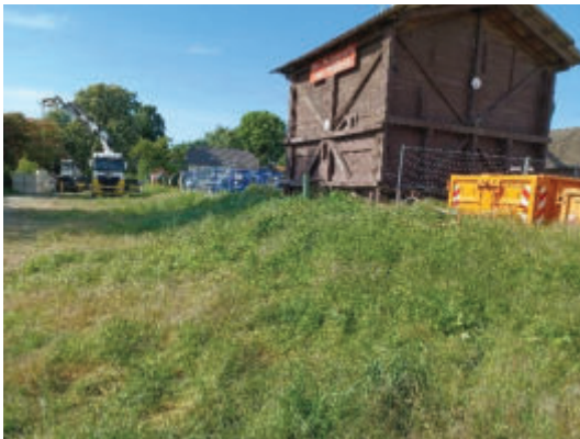
Rückseite des Silos mit Böschung. (PLÖG, 2025)