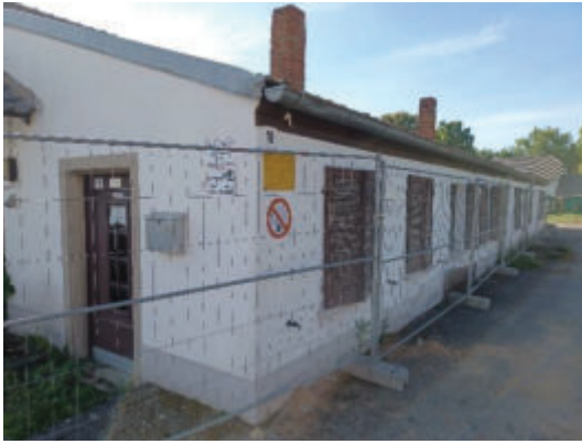
Sägewerk, Blick von Nordwesten. (PLÖG, 2025)