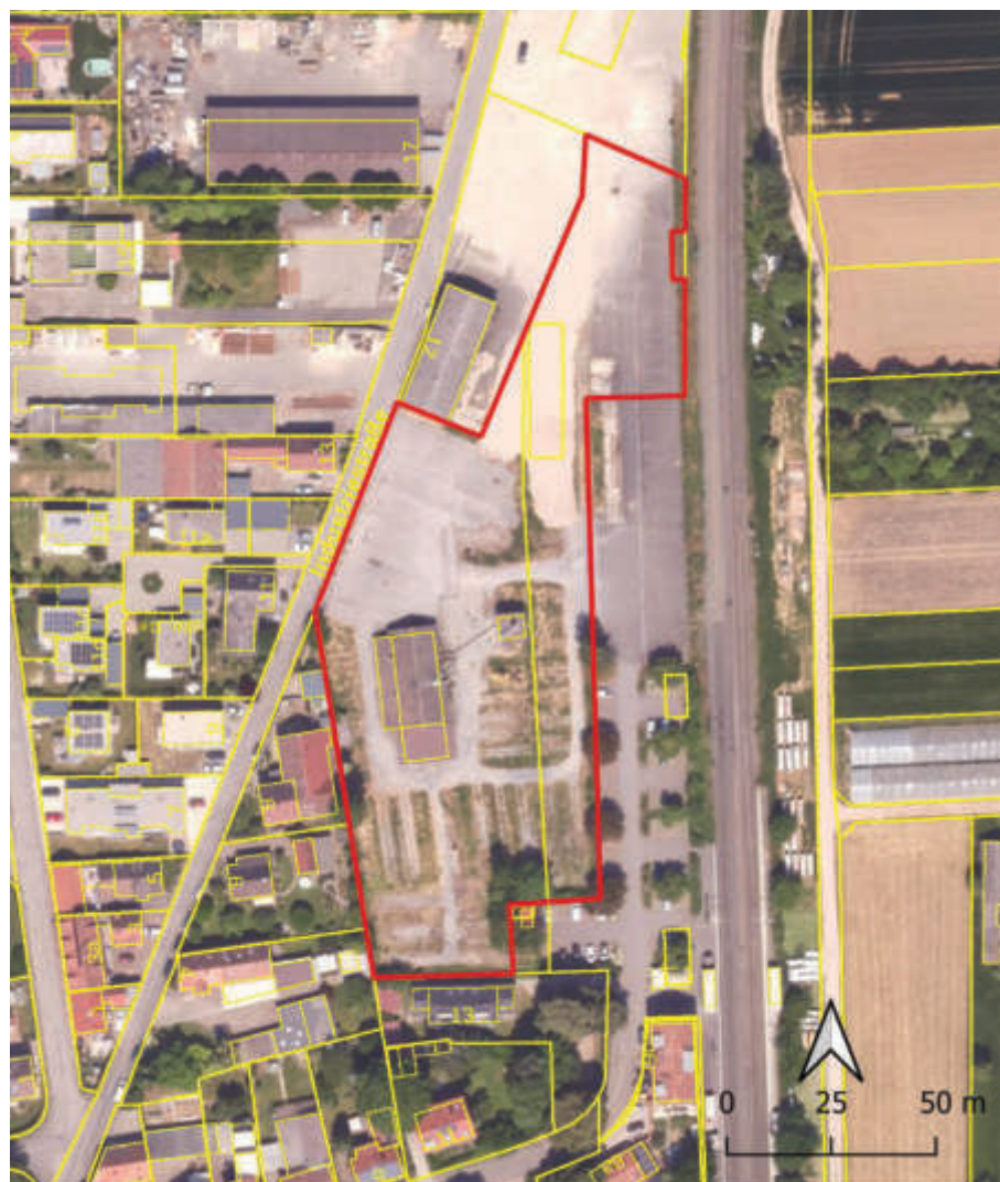
Darstellung: PLÖG (2025) Umgriff: Wegner Stadtplanung (2025) Parzellenkarte und Luftbild: Bayerische Vermessungsverwaltung (2025) www.geodaten.bayern.de

Der Geltungsbereich umfasst die Flurstücke 4816, 4816/3 und 6218/7 (teilw.), Gmkg. Bergtheim, Gmde. Bergtheim. Die Gesamtfläche beträgt ca. 0,95 ha. Die Fläche ist zu großen Teilen versiegelt, von den baulichen und technischen Anlagen stehen noch das Sägewerk selbst, sowie das Silo für Sägespäne. Es befinden sich keine Bäume oder Gehölze im Geltungsbereich. Östlich an den Geltungsbereich angrenzend verläuft die Bahnlinie Würzburg-Schweinfurt, südöstlich befindet sich der Bahnhof Bergtheim mit Parkplatz. Südlich, westlich und nördlich befinden sich Wohngebäude mit Baum- und Gehölzbeständen und einige Industrieflächen. Der Geltungsbereich befindet sich an der östlichen Ortsrandlage von Bergtheim.