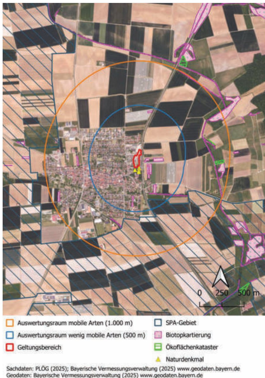
Abbildung 4: Flächenkulisse

Südlich und westlich von Bergtheim befinden sich Teilbereiche des europäischen Vogelschutzgebiets (SPA-Gebiet) „Ochsenfurter und Uffenheimer Gau und Gäulandschaft Nö Würzburg“. Unmittelbar südlich des Geltungsbereichs, auf den Flurstücken 4769/2, 4769/3 und 6218/4, befinden sich mehrere als Naturdenkmal (punktförmig) eingetragene Kastanien und eine Linde. Östlich des Geltungsbereichs, auf der anderen Seite der Bahnlinie, befinden sich mehrere biotopkartierte Streuobstbestände.