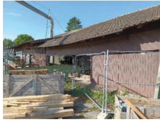
Sägewerk, Blick von Nordosten. (PLÖG, 2025)