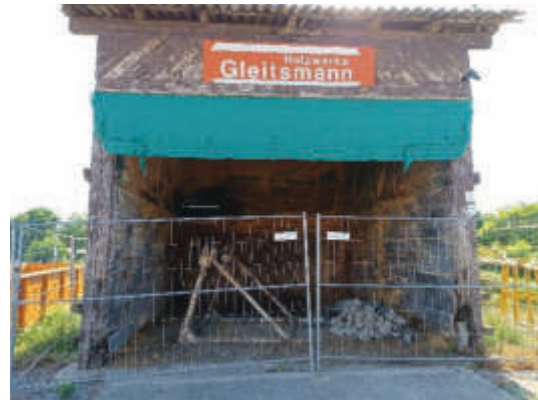
Vorderseite des Silos. (PLÖG, 2025)