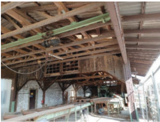
Sägewerk, Inneres der Halle. (PLÖG, 2025)