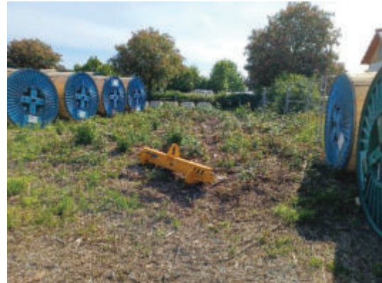
Südlicher Teil des Geltungsbereichs. (PLÖG, 2025)