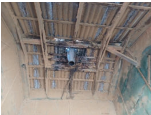
Dachbereich des Silos. Gut sichtbar die zusammengesetzten Balken. (PLÖG, 2025)