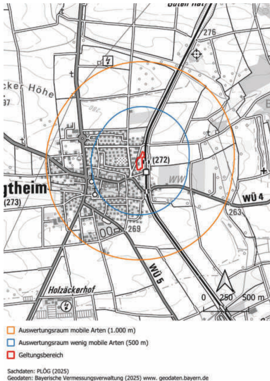
Abbildung 3: Auswertungsräume