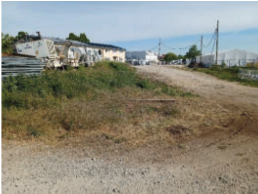
Blick nach Norden über den Osten des Geltungsbereichs. (PLÖG, 2025)