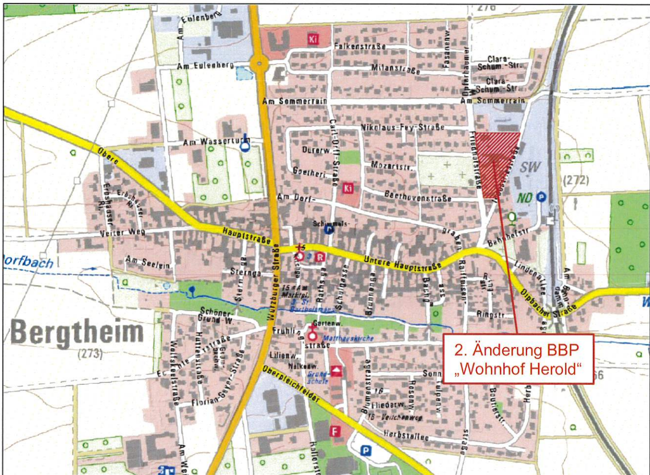
Abbildung 1: Topographische Übersichtskarte TOP 50 mit Geltungsbereich