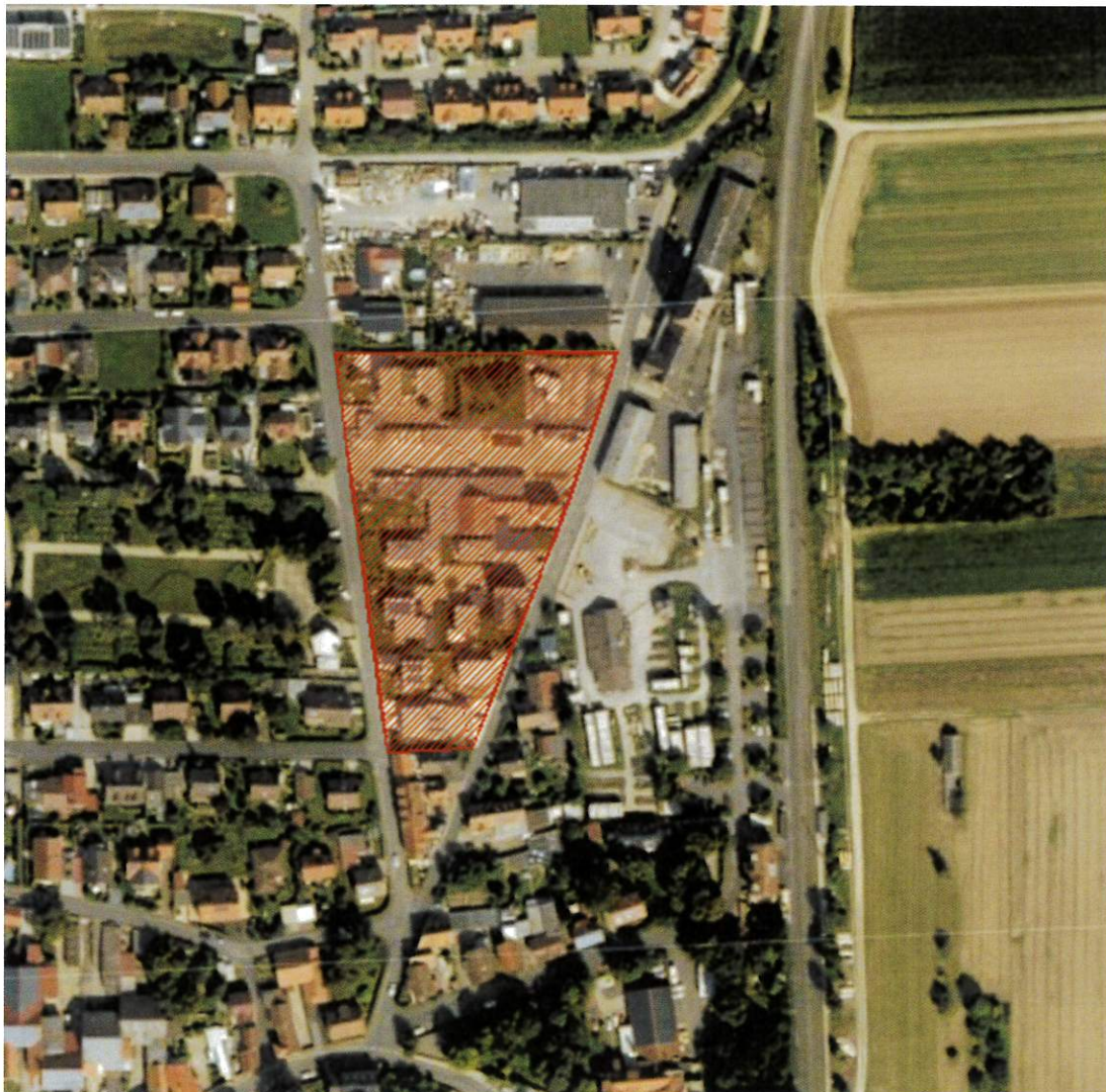
Abbildung 3: Luftbild mit Umgriff (rote Schraffur)

Das Plangebiet für die 2. Änderung des Bebauungsplanes „Wohnhof Herold“ liegt in einem leicht nach Süden geneigten Bereich am nordöstlichen Ortsrand von Bergtheim. Die Anbindung an das öffentliche Verkehrsnetz erfolgt über das vorhandene Straßennetz der Gemeinde Bergtheim. Hierbei sind vorrangig die Industriestraße und die Friedhofstraße als Anbindung zu sehen, die sich östlich bzw. westlich vom Geltungsbereich der 2. Änderung des Bebauungsplanes „Wohnhof Herold“ befinden. Nördlich grenzen der Bauhof der Gemeinde Bergtheim sowie gewerblich genutzte Strukturen an. Im Westen des Planungsbereiches liegen der Friedhof der Gemeinde Bergtheim bzw. die gewachsenen Wohnbaustrukturen der Gemeinde. Südlich des Planungsbereiches grenzen ältere Wohnbaustrukturen an, die den Übergang zur dörflichen Nutzungsstruktur des Altortes von Bergtheim bilden. Östlich befinden sich aufgelassene gewerbliche Nutzungsstrukturen bzw. Einrichtungen und Lagerflächen, die ursprünglich dem Gütertransport der Bahn dienen. Derzeit ist eine untergeordnete Nutzung als Parkplatz- und Lagerfläche mit geringer Frequentierung anzunehmen. An diese Flächen binden östlich die eigentlichen Bahnanlagen an.